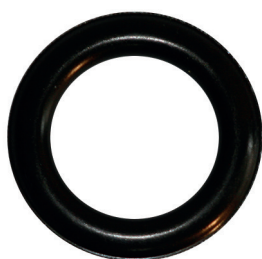
CANON DE FUSIL